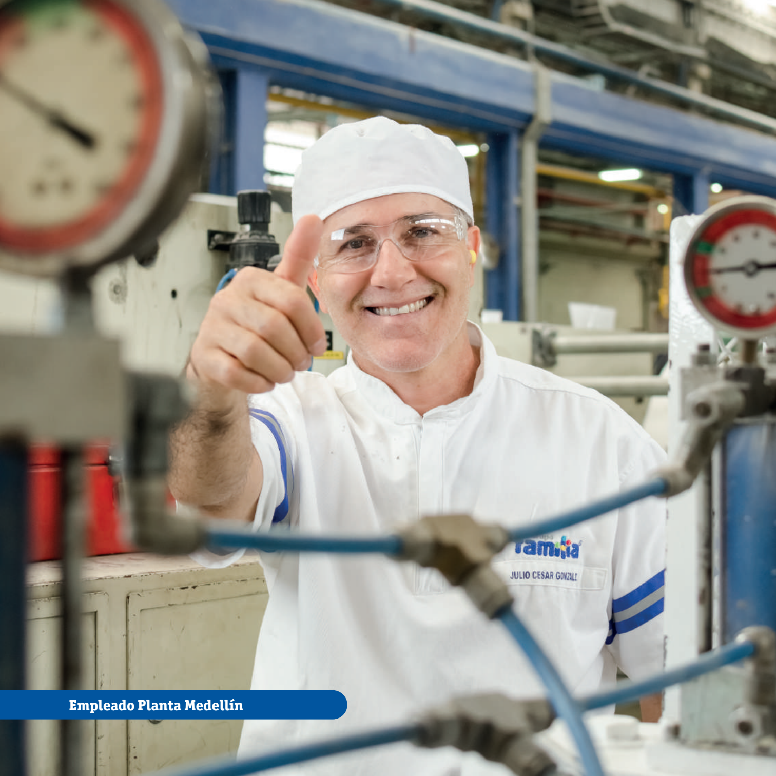
Empleado Planta Medellín