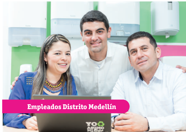
Empleados Distrito Medellín