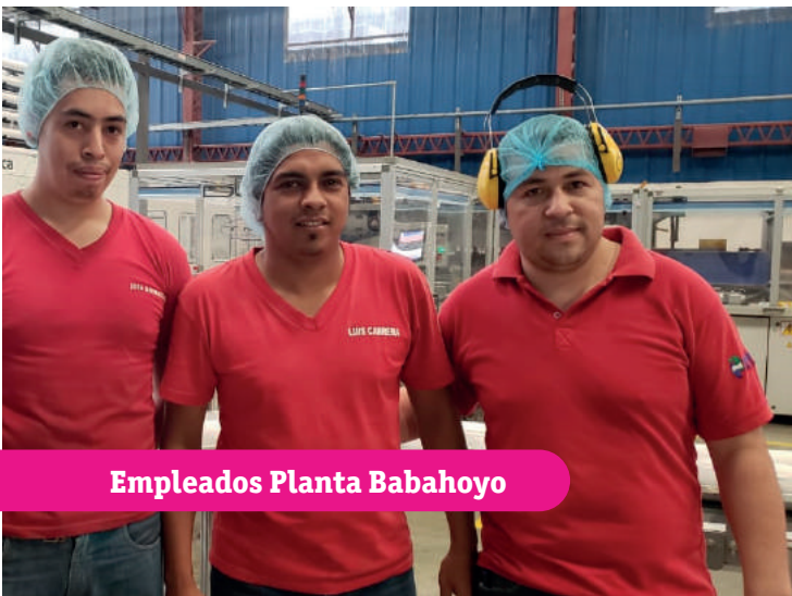
Empleados Planta Babahoyo