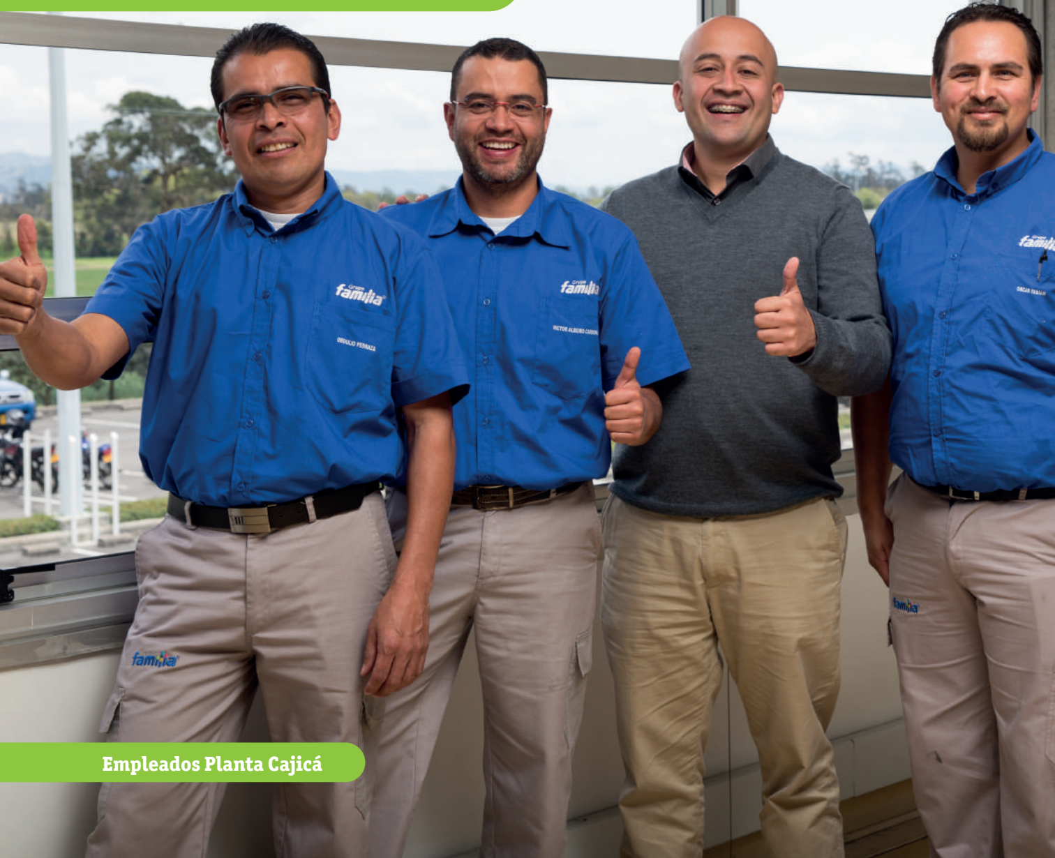
Empleados Planta Cajicá