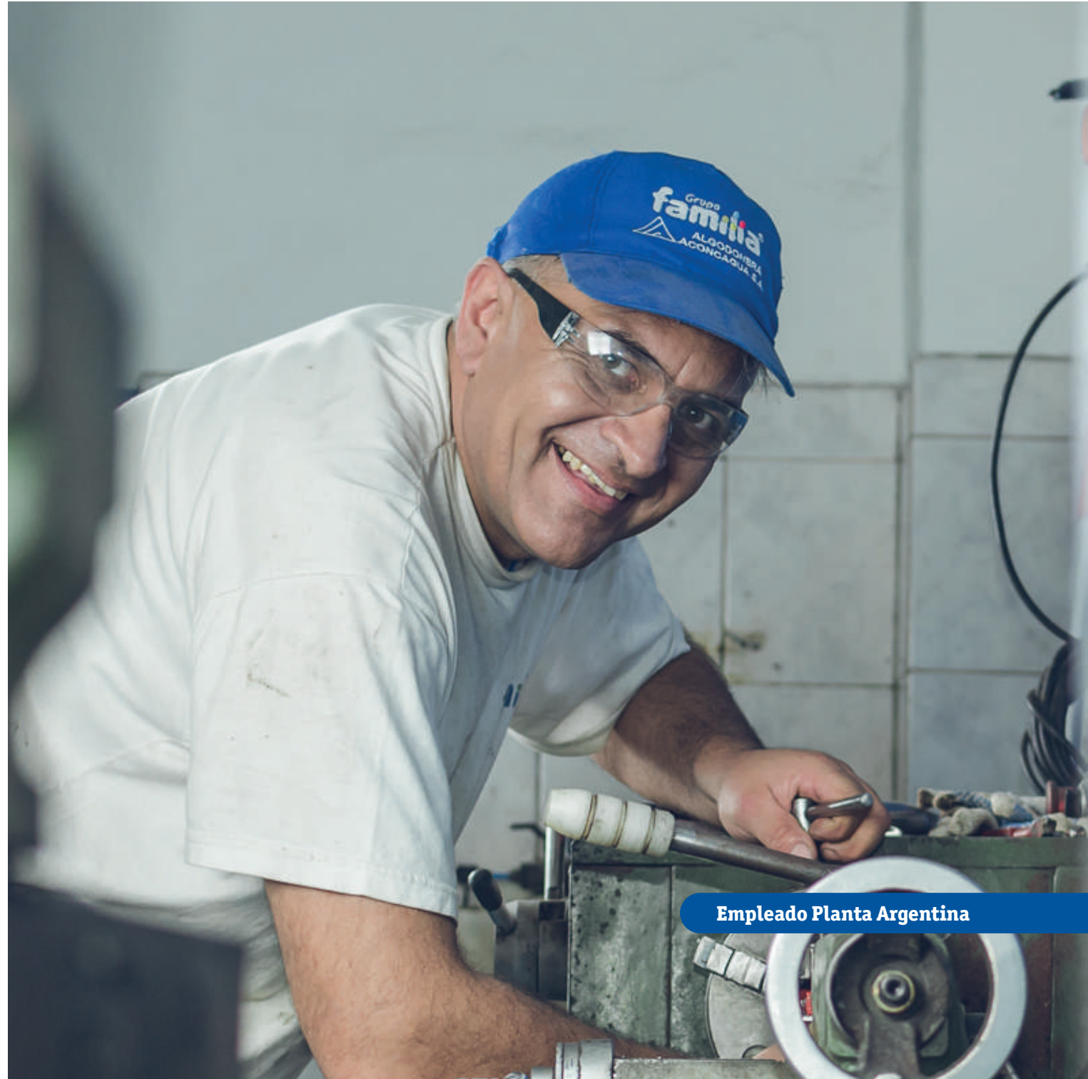
Empleado Planta Argentina

Consulta nuestro manual SAGRIFT. *Aplica solo para Colombia.