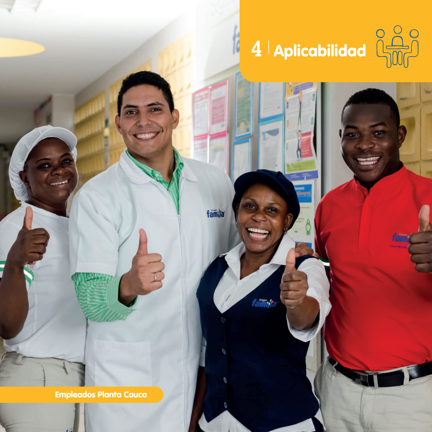
Empleados Planta Cauca