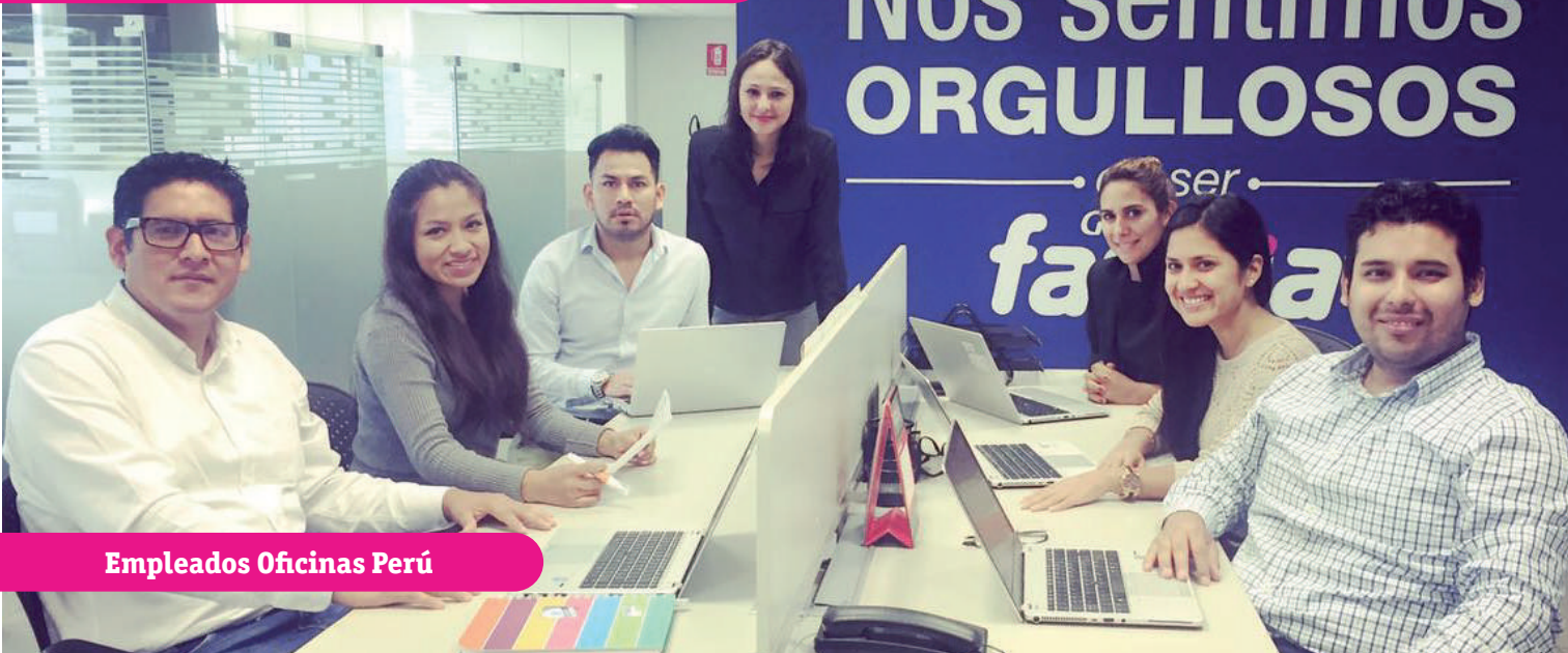
Empleados Oficinas Perú